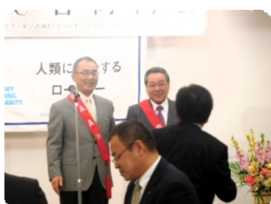
次年度 ガバナー補佐 分区幹事