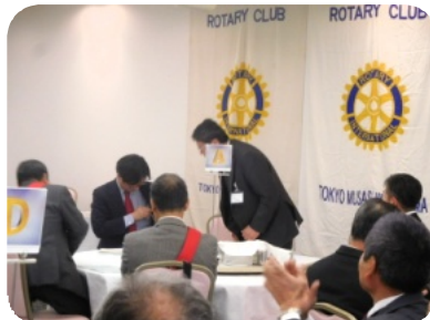
お客様 多摩分区 加瀬澤分区幹事