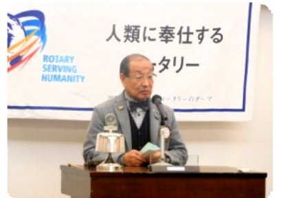
出席報告 東大和RC 守重委員長