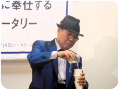
アトラクション 手品披露