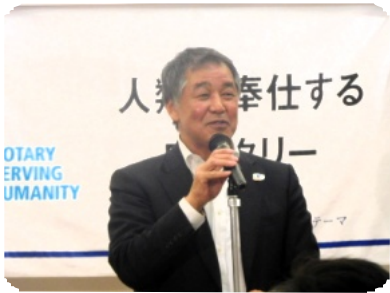
次回ホストクラブ会長挨拶