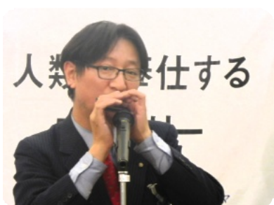
ハーモニカ披露 石川ガバナー補佐