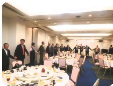
手に手つないでで盛大に終了