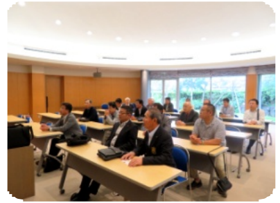
真剣に卓話を聞き入る会員