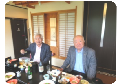
昼食は三島市の「松韻」にていただきました。