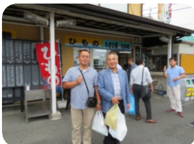
お土産（沼津） 皆さん沢山購入されてました。これも地域貢献！