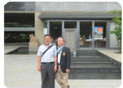
三島大社（会長・幹事）