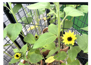
沢山の花を咲かせてます！！ 蕾も沢山あり元気に育ってます。