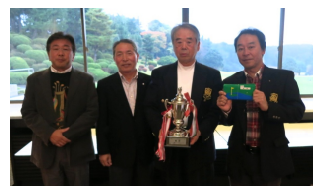
地区親睦ゴルフ大会